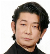
永瀬正敏 公園で妻を待ち 続けている男。