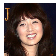
高岡早紀 幸せについて質問。