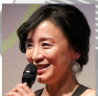
神野三鈴 待たれている妻。

1990 年生まれ。映画出演が多い。主演だけでも「半分の月がのぼ る空」(2010)「自分の事ばかり で情けなくなるよ」(2013)「愛 の渦」(2014)「セトウツミ」(2016)「夜空はいつでも最高密度の 青色だ」(2017)「宮本から君へ」 (2019)「白鍵と黒鍵の間に」(2023) などがある。